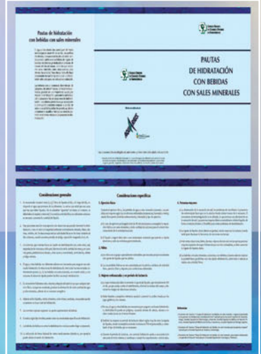
Fig.1. Documento técnico de consenso "Pautas de hidratación con bebidas con sales minerales"

Estos materiales se distribuyeron entre las oficinas de Farmacia a través de los Colegios Oficiales de Farmacéuticos Provinciales. Asimismo, los farmacéuticos colegiados tuvieron acceso a los materiales a través de www.portalfarma.com .