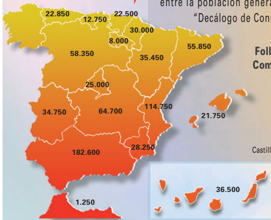
Folletos distribuidos por Comunidades Autónomas

A través de las oficinas de Farmacias españolas, se distribuyeron entre la población general un total de 961.850 folletos con el "Decálogo de Consejos para prevenir la deshidratación"