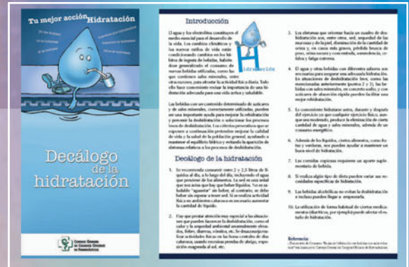
Fig.2. Folleto con el "Decálogo de Consejos para prevenir la deshidratación"